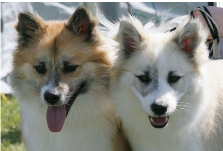
Kuva 8 Anne Vaskio

Viimeisenä tähän osioon otetaan korvat. Niiden pitäisi olla rotumääritelmän mukaan seuraavan laiset. Pystyt ja keskikokoiset, etäälle toisistaan mutta eivät matalalle kiinnittyneet. Muodoltaan lähes tasasivuisen kolmion muotoiset, hieman kärjestään pyöristyneet ja tanakasti pystyssä. Erittäin liikkuvaiset, reagoivat herkästi ääniin ja kuvastavat koiran mielialaa. Meillä rodussa on myös luppakorvaisia tai toispuoleisia luppakorvia, ne eivät ole ihanteen mukaisia eivätkä ehkä näyttelytähtiä, mutta tämä ei tee koirastasi yhtään huonompaa! Alla kuva oikein kivoista korvista.