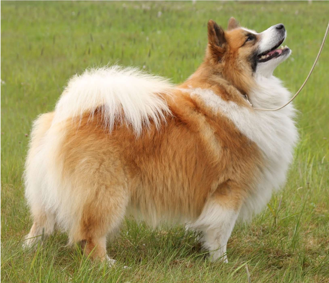
Kuva 2 Riika Kivirinta

Rotumääritelmä kertoo meille myös, että sukupuolileiman pitäisi olla selkeä. Uros ja narttu pitäisi olla siis helposti erotettavissa toisistaan. Myös kauempaa katsoessa, ainakin jos näkyvillä on sekä uros, että narttu. Alla olevassa kuvassa on mielestäni oikein selvästi nähtävillä, että vasemmalla on narttu ja oikealla uros. Koko ja pään muoto, ovat jo selkeästi kertomassa kumpi on kumpi.